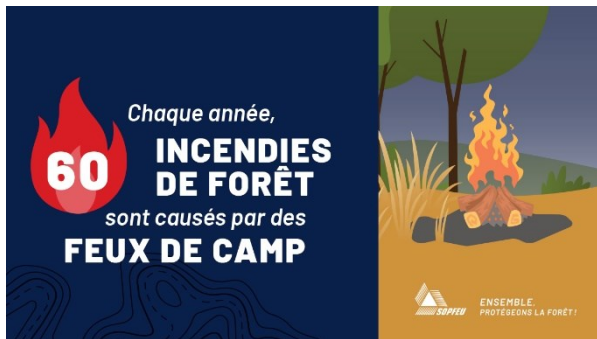
Figure 3. Affiche de sensibilisation sur les feux de camp et les feux de forêt, SOPFEU

Les risques de feux de forêt associés à l'allumage de feux en nature sont bien connus et mis de l'avant dans plusieurs outils de gestion et de sensibilisation. Dans la vaste majorité des documents analysés, l'interdiction d'allumer des feux dans des sites de camping (tant dans des parcs nationaux que dans des aires naturelles non protégées) provient d'une évaluation du risque de feux de forêt (ex. : en période de sécheresse). Le ministère des Ressources