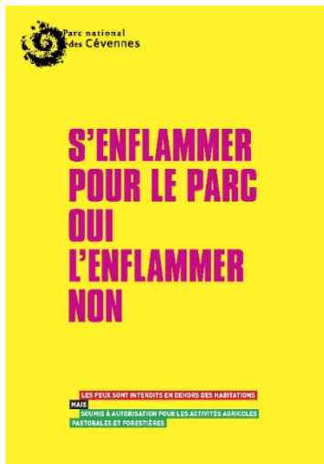
Figure 6. Exemple de publicité de sensibilisation au parc national de Cévennes, en France

Aux États-Unis, le parc national de Yosemite a mis de l'avant un indicateur visant à assurer un suivi de la qualité de l'air. Le parc national indique sur son site internet que la fumée associée aux feux de camp peut être néfaste pour la santé humaine et déconseille aux personnes souffrant de problèmes respiratoires de venir au parc lorsque la qualité de l'air est évaluée comme étant mauvaise (National Park Service, 2022). L'Agence de Protection de l'Environnement des États-Unis (EPA - United States Environmental Protection Agency ) présente de nombreux articles concernant les risques que comportent la fumée sur la santé