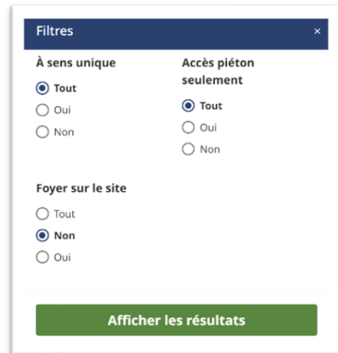
Figure 5. Capture d'écran du site de réservation de terrain de camping de Parcs Canada permettant de choisir un site de camping sans foyer (Parcs Canada, 2023)

Dans la province du Nouveau-Brunswick, il semble que la loi sur l'assainissement de l'air qui encadre les émissions polluantes est plus englobante que la réglementation québécoise. En effet, elle requiert un agrément et impute la responsabilité des effets nocifs de la pollution de l'air à toute personne qui rejette des polluants (LN-B 1997, c C-5.2). Le rapport sur l'évaluation de la qualité de l'air du camping de Shediac est un bon exemple de processus qui découle de cette loi (Section Effets sur la qualité de l'air).