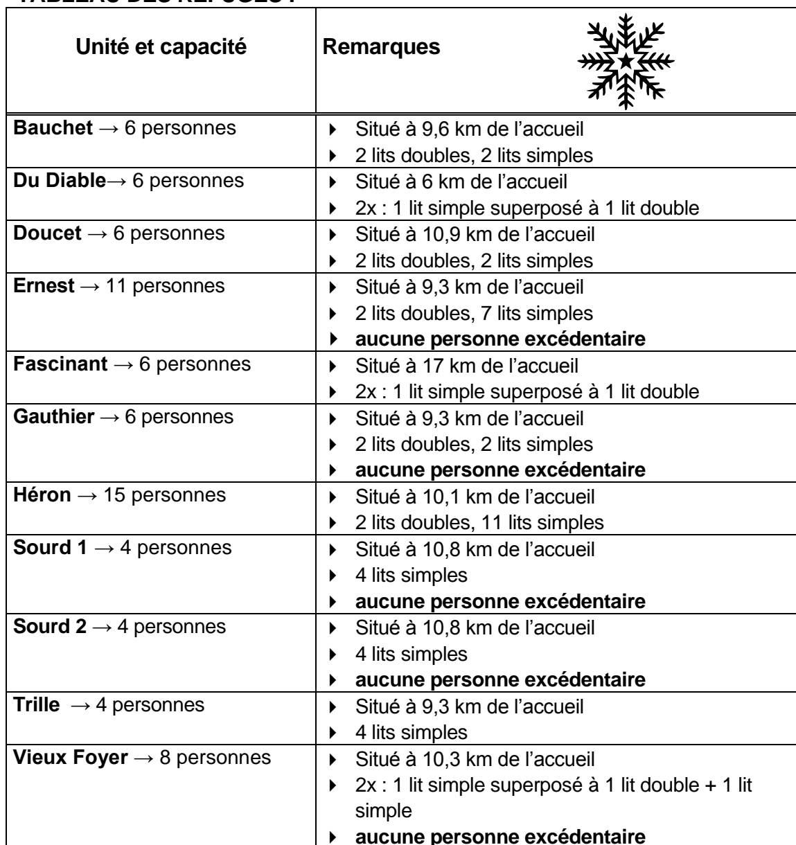
TABLEAU DES REFUGES :

Le principe d'un refuge : Les refuges servent de relais pour les randonneurs durant la journée. L'exclusivité des refuges est garantie entre 16 h et 9 h pour les clients ayant réservé une nuit. Possibilité de jumeler plusieurs réservations dans le même refuge tant que la capacité n'est pas atteinte.