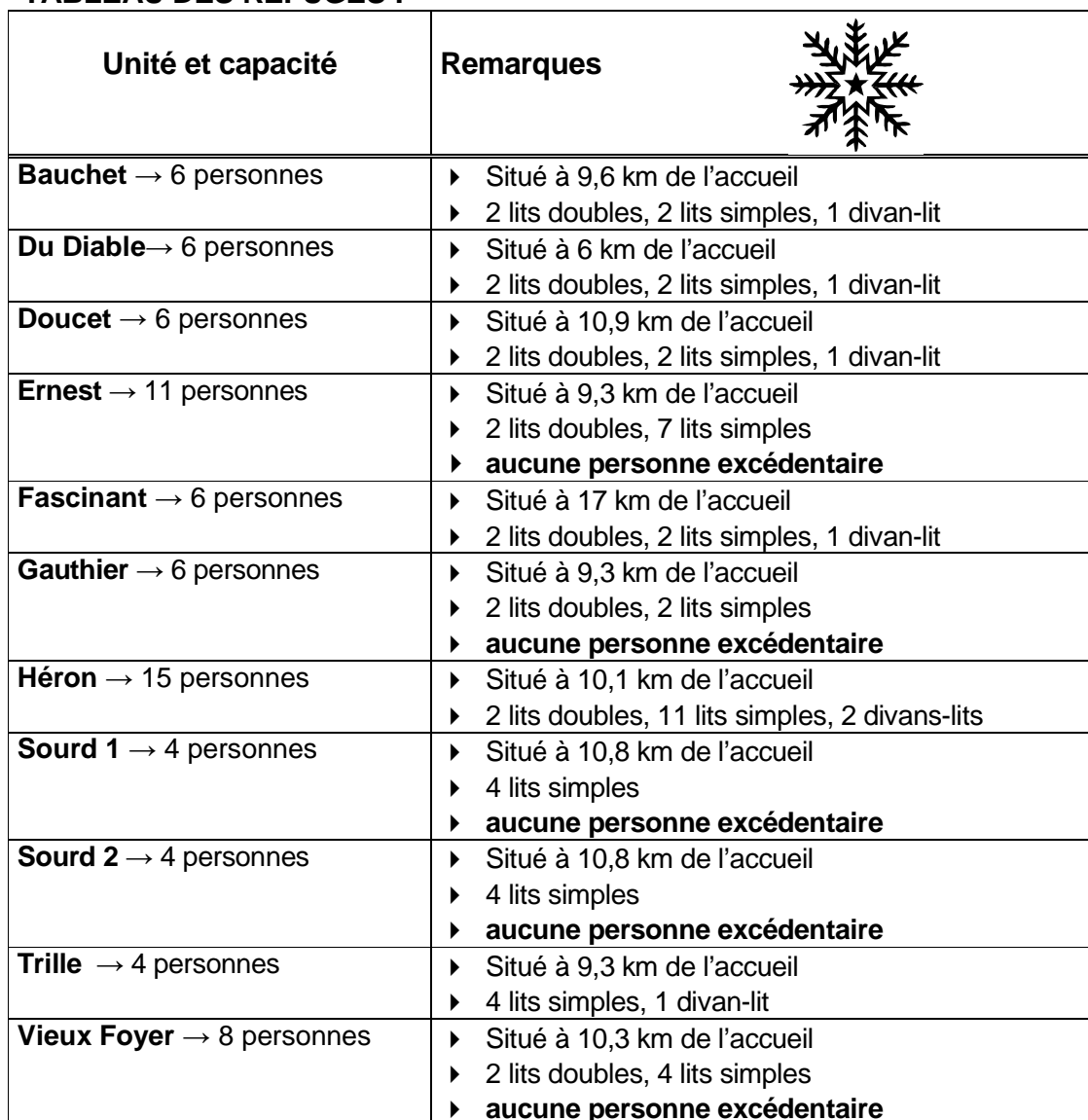
TABLEAU DES REFUGES :

Le principe d'un refuge : Les refuges servent de relais pour les randonneurs durant la journée. L'exclusivité des refuges est garantie entre 16 h et 9 h pour les clients ayant réservé une nuit.