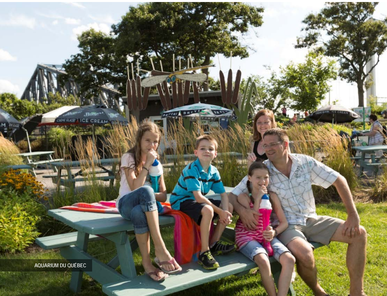
AQUARIUM DU QUÉBEC