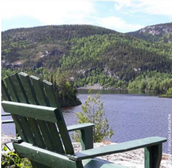
par José-François Larouche

Le locataire doit respecter les conditions du bail et payer annuellement le loyer ainsi que les taxes municipales et scolaires. Le locataire doit respecter les lois et règlements municipaux, provinciaux et fédéraux, notamment ceux qui touchent la faune et l'environnement, et se conformer aux normes de la municipalité locale et de la MRC pour l'aménagement du terrain.