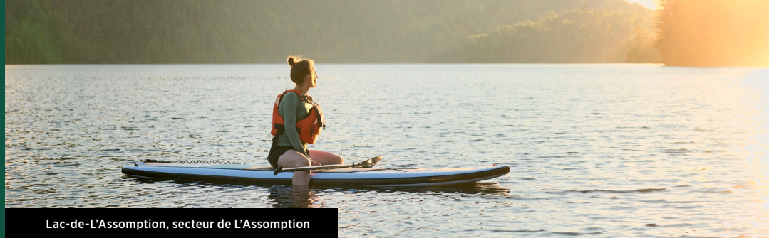
Lac-de-L'Assomption, secteur de L'Assomption