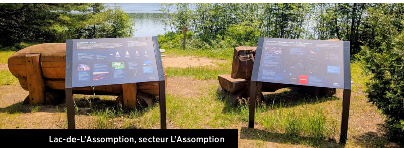
Lac-de-L'Assomption, secteur L'Assomption