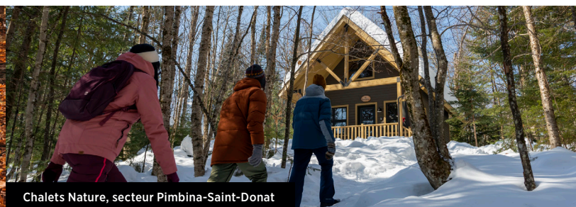
Chalets Nature, secteur Pimbina-Saint-Donat