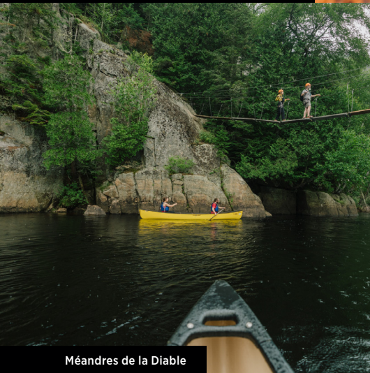
Méandres de la Diable

Explorez la rivière du Diable et ses trésors vivants qui se donnent en spectacle sous vos yeux.