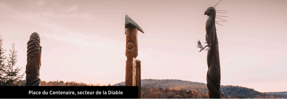
Place du Centenaire, secteur de la Diable