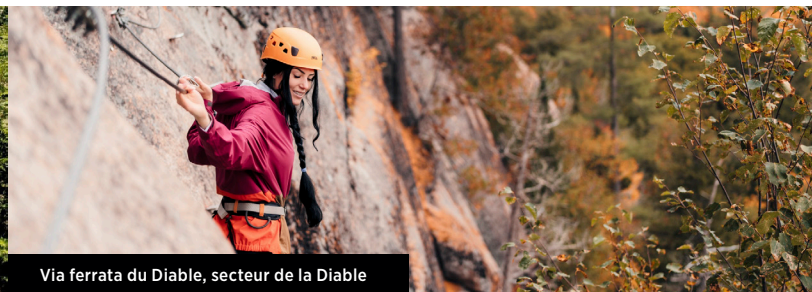
Via ferrata du Diable, secteur de la Diable