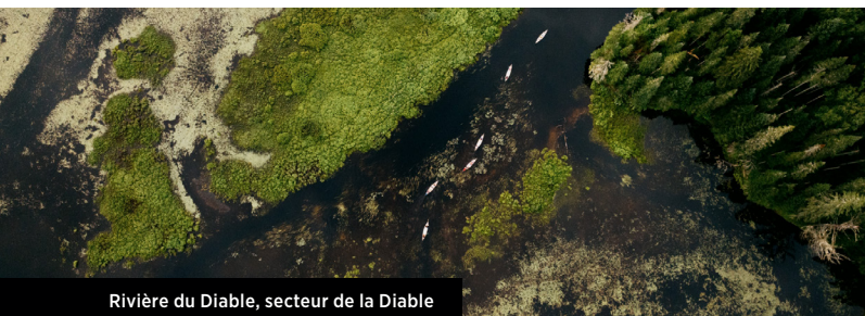
Rivière du Diable, secteur de la Diable

Encadrée par un professionnel, cette expérience promet une aventure mémorable où adrénaline et sentiment de liberté se conjuguent à la grandeur des décors naturels du parc. Sensations fortes assurées ! Consultez les détails à la page 6.