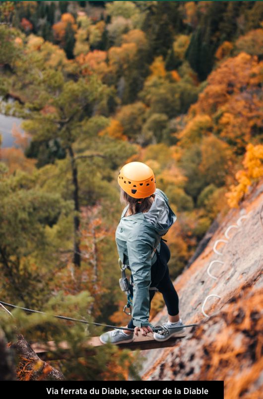
Via ferrata du Diable, secteur de la Diable