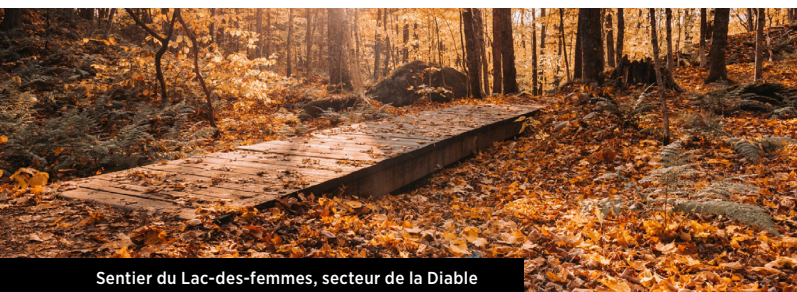
Sentier du Lac-des-femmes, secteur de la Diable

La Chute-aux-Mûres, dans le secteur de la Cachée, se distingue par la présence d'une charmante petite passerelle en bois. Consultez le tableau des sentiers à la page 3 pour plus d'informations.