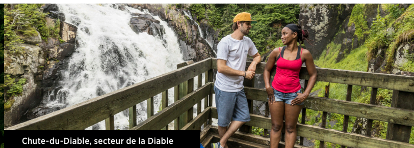
Chute-du-Diable, secteur de la Diable