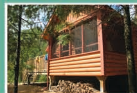
CHALET SAPIN N° 2