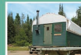
CAMP DE PROSPECTEUR