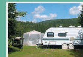
TERRAIN DE CAMPING