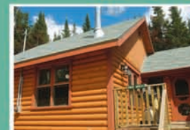
CHALET SAPIN N° 1