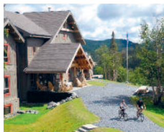
Auberge de montagne des Chic-Chocs