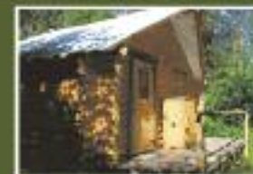
HALTE DES DRAVEURS