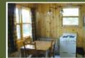
CHIGOUBICHE, 9 CHALETS RÉNOVÉS