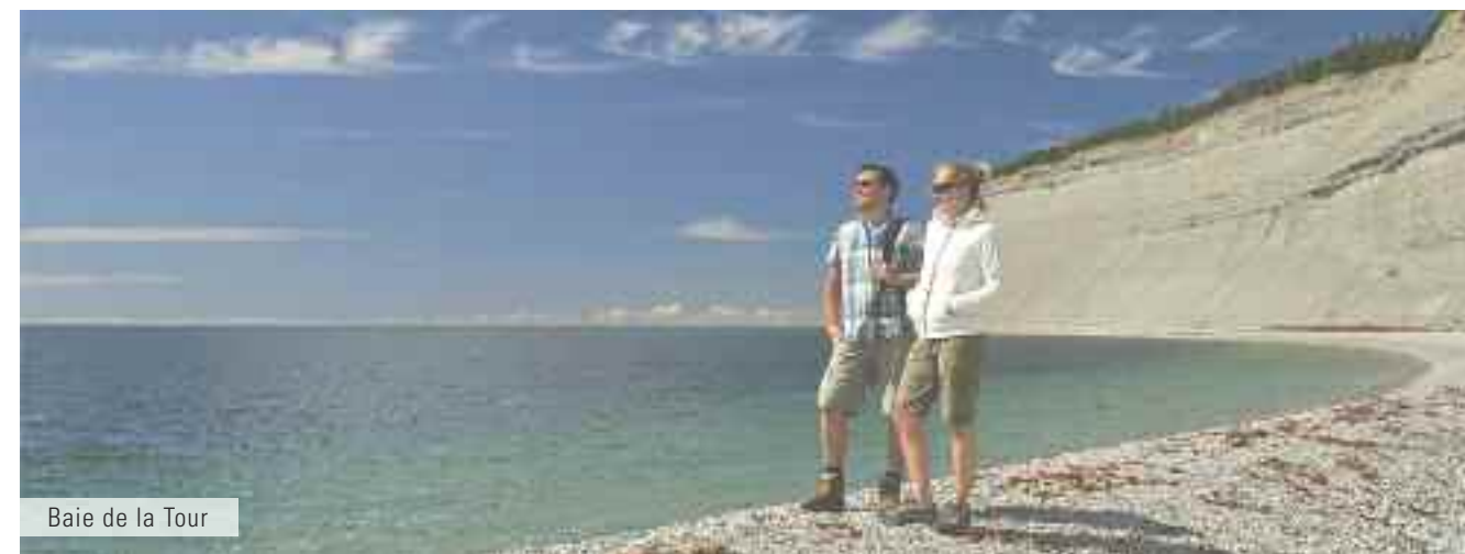
Baie de la Tour