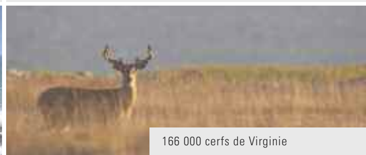
166 000 cerfs de Virginie