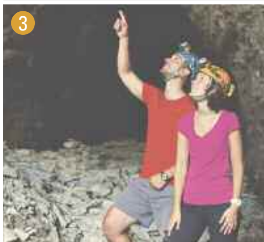
Grotte à la Patate