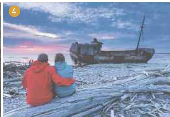
Baie-Sainte-Claire et l'épave du Calou