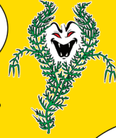
Myriophyllum à épis

UN SEUL FRAGMENT DE FEUILLE ME SUFFIT POUR COLONISER DE NOUVEAUX PLANS D'EAU ET REMPLACER LES VÉGÉTAUX D'ORIGINE!