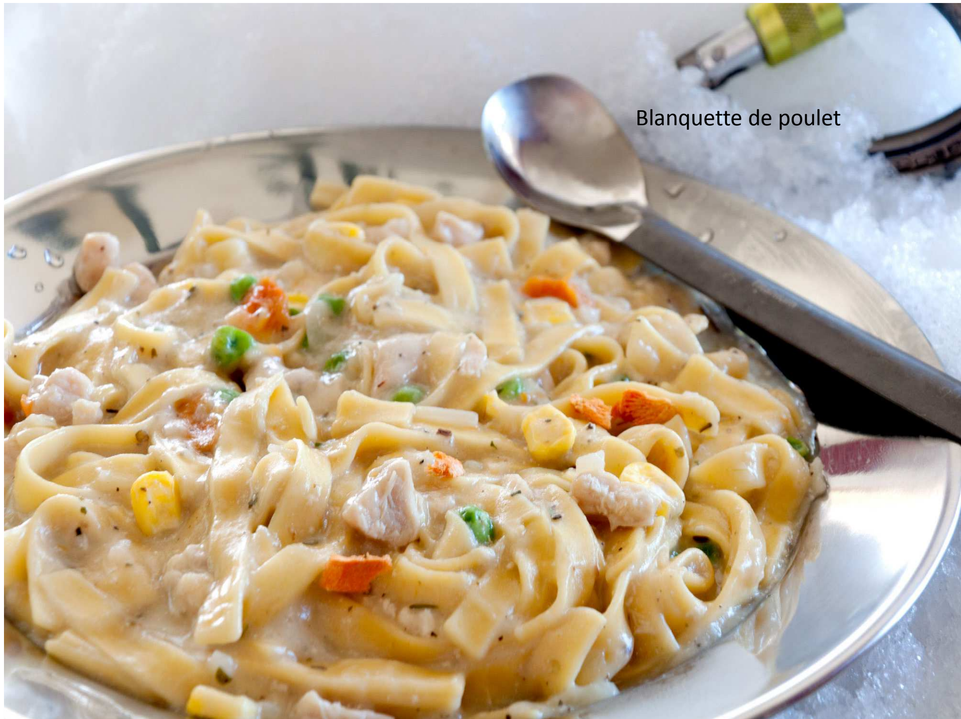
Blanquette de poulet