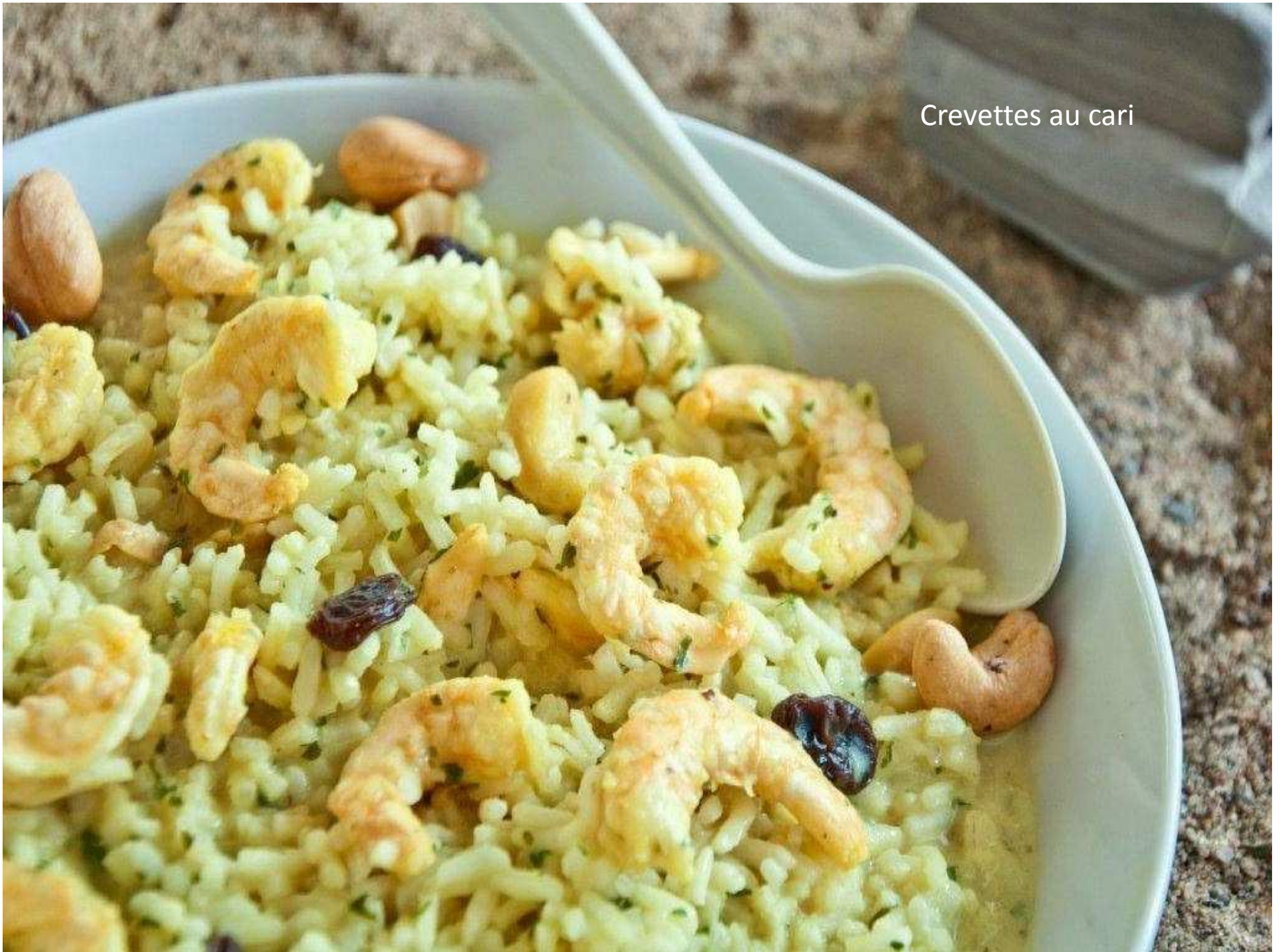
Crevettes au cari