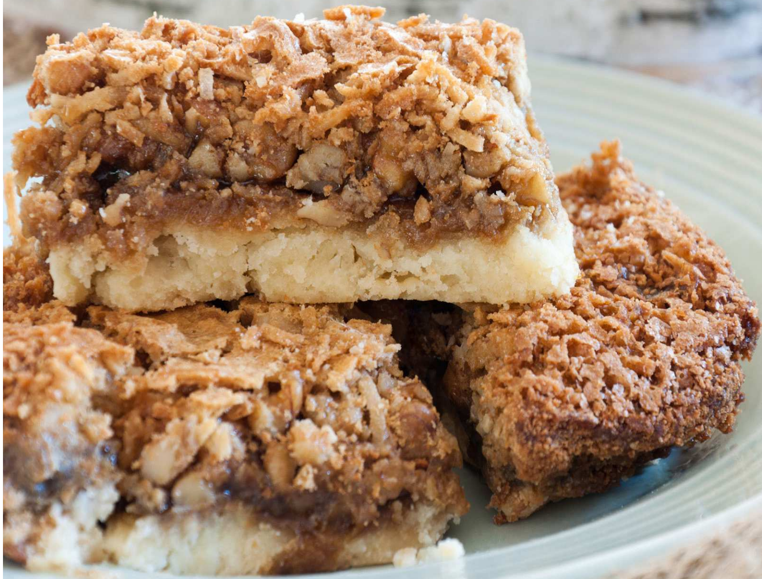
Carré de rêves