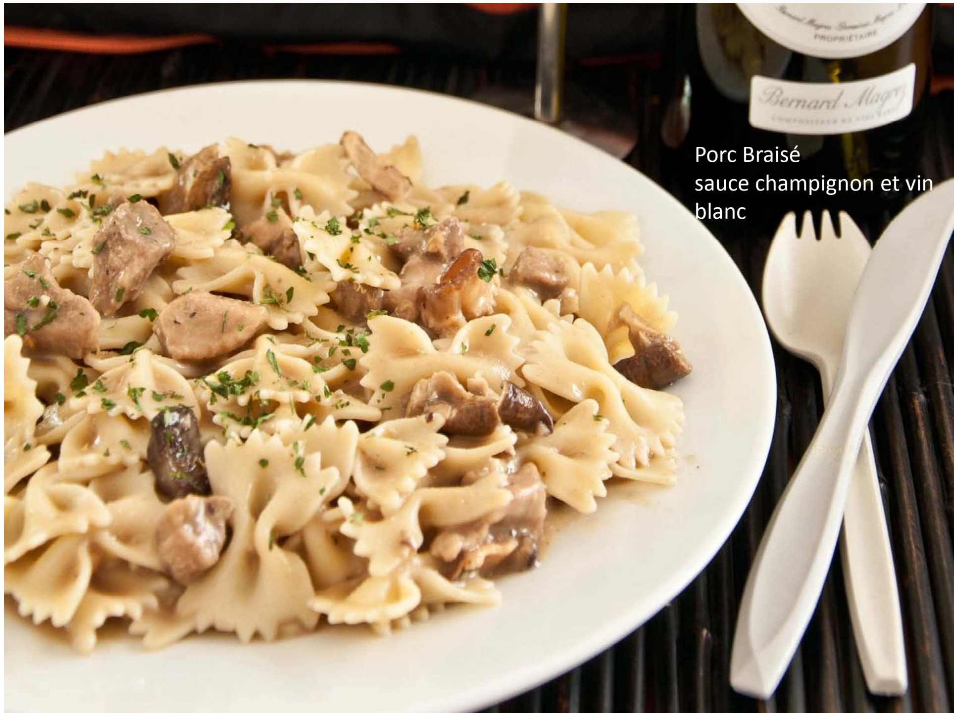
Porc Braisé sauce champignon et vin blanc