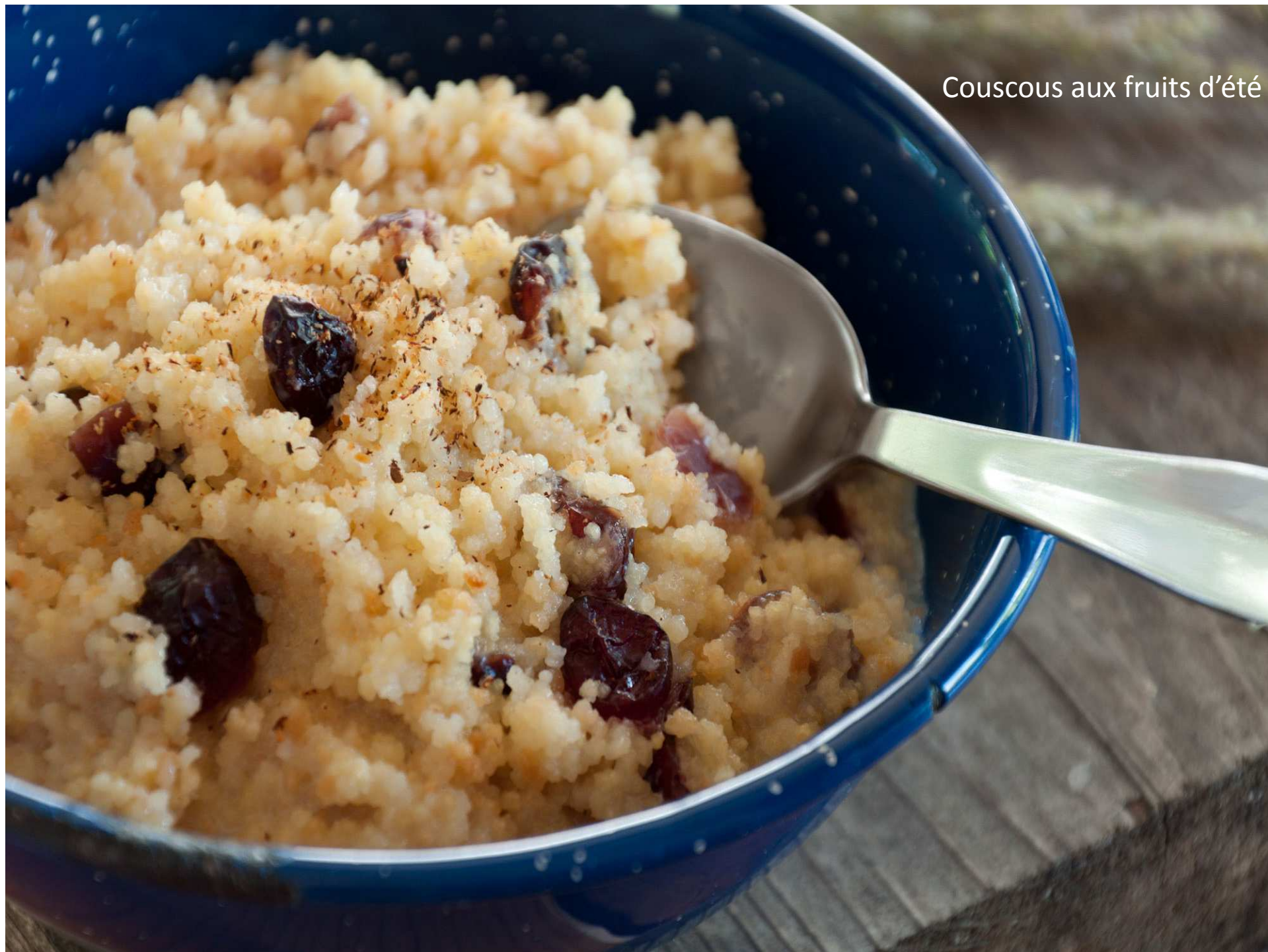
Couscous aux fruits d'été