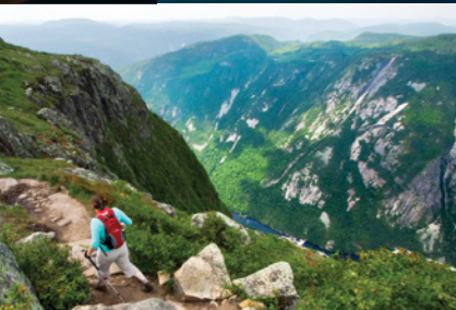
PARC NATIONAL DES HAUTES-GORGES-DE-LA-RIVIÈRE-MALBAIE