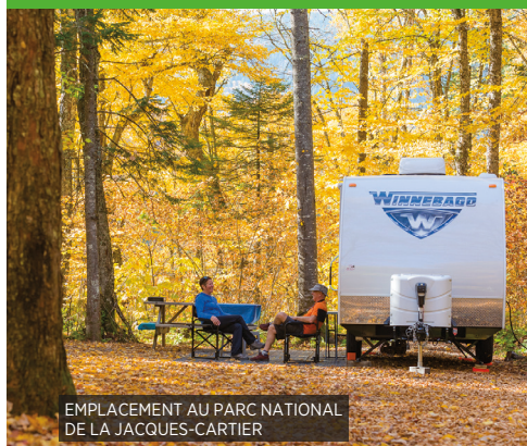
EMPLACEMENT AU PARC NATIONAL DE LA JACQUES-CARTIER