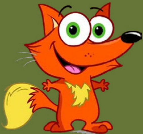
Raffi le renard roux, animal emblème du parc national des Îles-de-Boucherville

Depuis son ouverture officielle en 1984, le parc accueille annuellement plus de 3 000 jeunes de tout horizon. La visite au parc national permet un contact privilégié avec la nature sauvage, des rencontres mémorables avec la faune québécoise et l'occasion unique d'effectuer des apprentissages de façon ludique.